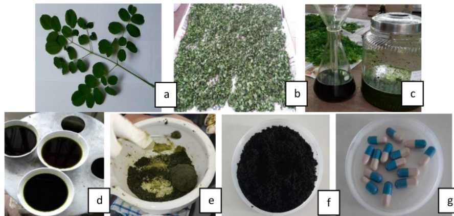
Gambar 1. Proses pembuatan kapsul ekstrak daun kelor

Penelitian ini diawali dengan pengumpulan daun kelor yang berasal dari Kabupaten Bantul dan Kulonprogo pada waktu sore untuk menghindari penguapan yang berlebih saat daun akan dikeringkan. Daun segar setelah dipetik dapat terlihat pada Gambar 1a . Daun segar dipipil dan dilakukan pengeringan pada suhu 50°C selama kurang lebih 48 jam dalam oven. Gambar daun kelor kering terlihat pada Gambar 1b . Daun kelor dari Kabupaten Bantul dan Kulonprogo masing-masing dimaserasi menggunakan etanol 90% yang terlihat pada Gambar 1c dan dilakukan remaserasi 2x kemudian diuapkan sehingga menjadi ekstrak kental. Rendemen yang didapatkan untuk masing masing ekstrak dari Kulonprogo 15,4% dan Bantul 12,3%. Ekstrak kental yang didapat dibuat granul dengan mengacu pada kebiasaan masyarakat mengonsumsi daun kelor segar 2 gram/hari. Sehingga untuk pembuatan 1 kapsul ekstrak kelor dari Kulonprogo dibutuhkan 0,30 g ekstrak kelor untuk dijadikan kapsul dengan bobot masing masing 1000 mg sejumlah 50 kapsul ( Gambar 1g ). Pembuatan granul dan hasil granul ekstrak kelor dengan penambahan bahan pengisi laktosa, bahan pemanis aspartame, dan bahan pelincir Mg stearate terlihat pada Gambar 1e dan Gambar 1f . Dipilih sediaan kapsul karena mudah dikonsumsi, takaran tepat, variabilitas rendah, memiliki keseragaman yang baik, dan praktis dalam penyimpanan dan mobilitas ( Fadhilah & Saryanti, 2019 ).