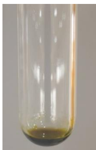
Gambar 2. Hasil Analisis Kualitatif Fenol

digunakan adalah larutan \text{FeCl}_3 yang dapat bereaksi dengan golongan senyawa fenol dalam minyak atsiri membentuk senyawa kompleks yang berwarna hijau kehitaman. Hasil positif yang menunjukkan adanya golongan senyawa fenol pada sampel jika terbentuk warna merah, hijau, biru ungu, atau hitam. Gambar 2 menunjukkan adanya warna hijau kehitaman sehingga minyak atsiri daun sirih hijau mengandung golongan senyawa fenolik.