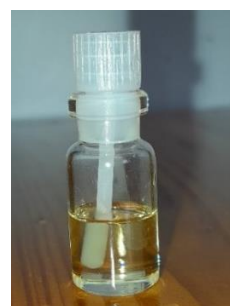
Gambar 1. Minyak Atsiri Daun Sirih Hijau

Daun sirih hijau yang digunakan dalam isolasi minyak atsiri adalah daun yang terletak dari bagian tengah ke arah pangkal batang sehingga umur daun cukup tua untuk mendapatkan kadar minyak atsiri yang optimal (Tripathi dan Hazarika, 2014). Isolasi minyak atsiri dari daun sirih hijau dapat dilakukan dengan teknik distilasi. Teknik distilasi yang digunakan adalah distilasi uap-air karena dapat efektif dalam menghasilkan volume minyak atsiri yang optimal untuk bahan yang berbentuk rumput, biji, dan daun. Distilasi uap-air ini menggunakan saringan yang berlubang untuk memisahkan antara air yang berada di bawah saringan dengan ketinggian mencapai sedikit di bawah saringan dan bahan yang didistilasi yang berada di atas saringan. Air yang berada di bawah saringan dapat dipanaskan dengan uap jenuh dengan tekanan tertentu atau dipanaskan langsung dengan api. Kelebihan distilasi uap-air ini adalah sampel tidak langsung kontak dengan air sehingga dapat mencegah terjadinya kerusakan senyawa akibat reaksi hidrolisis. Selain itu, sampel tidak mudah menggumpal apabila kontak dengan air panas dan penguraian minyak lebih kecil. Dari hasil isolasi dengan distilasi uap-air, minyak atsiri daun sirih hijau yang didapatkan berwarna kuning jernih dengan rendemen sebesar 0,1%. Gambar 1 menunjukkan penampilan dari minyak atsiri yang didapatkan.